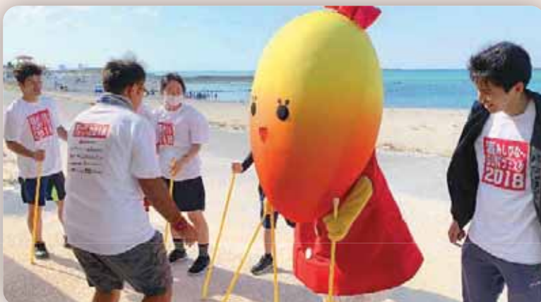
昨年の海あしびな—SUNフェスタ2018の様子

令和元年9月7日（土）豊崎海浜公園美らSUNビーチにおいて「海あしびな—SUNフェスタ2019」が開催されます。障がいのあるなしに関係なくみんなでビーチで遊んじゃおう!という企画です。ビーチではカヤック&バナナボート、浜辺ではスラックライン、遊歩道ではハンドサイクルといったアクティビティ満載の楽しいイベントです。今回、当協会はビーチ砂浜でのアクティビティを担当することになりエンジョイ・パスラリーを行う予定です。そこで、レクインストの皆さんのご協力をいただきたく、ボランティアスタッフを募集しますので一緒に盛り上げたいという方がいましたら県レクまでご連絡下さい。